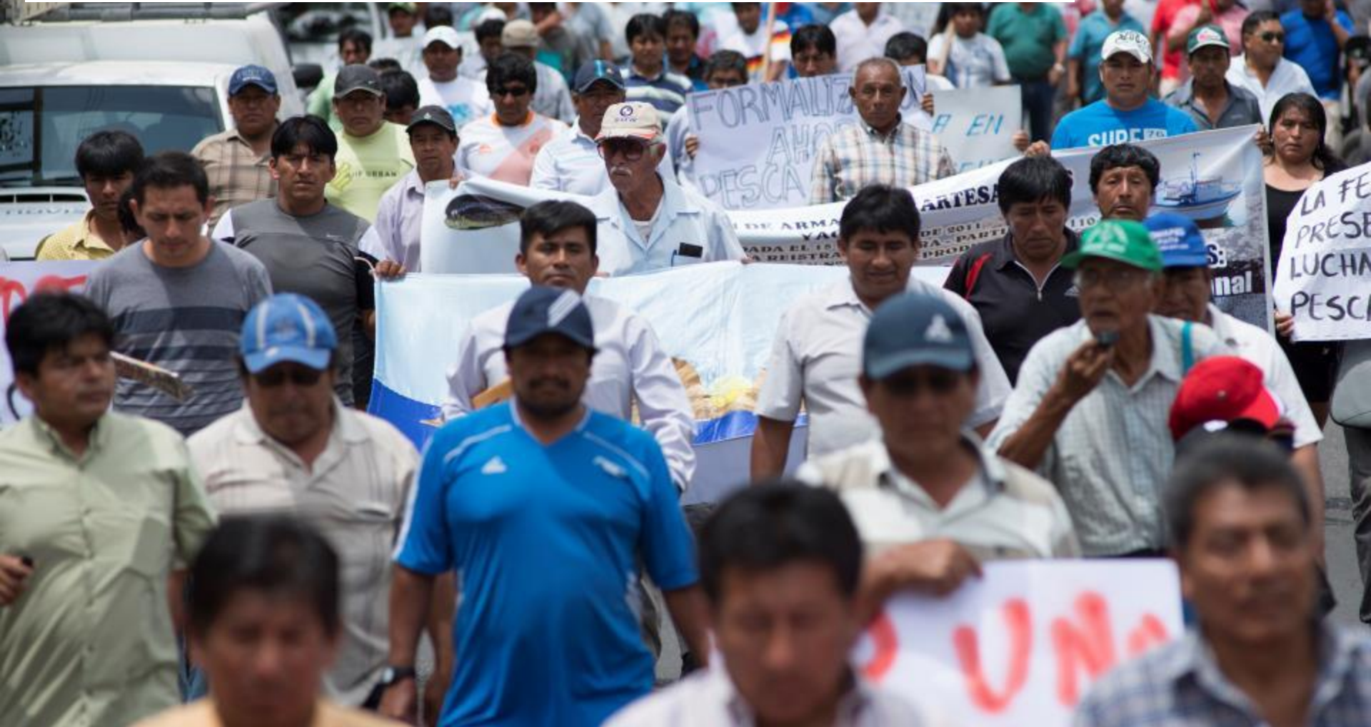
Marcha pacífica del 7 de octubre de 2015, Piura